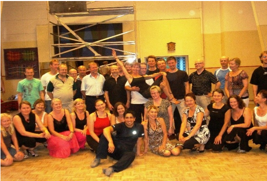
Ryhmäkuva Jyväskylän praktikan jälkeen..

Hänen opetustyyhinsä on rauhallinen ja painottaa kahden ihmisen yhteyttä tanssissa.